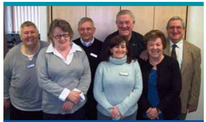
Tîm Perfformiad Grym Tenantiaid