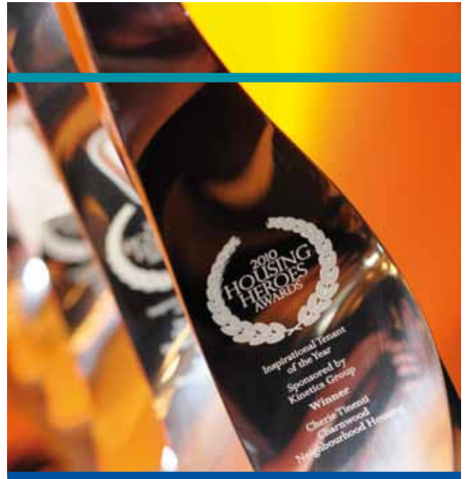
Tîm TG Newydd